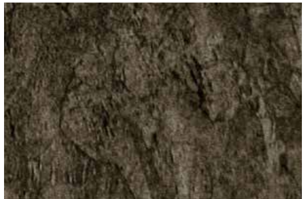
Luvata铬锆铜金相结构(颗粒较细)

Luvata Ohio Inc. 1376 Pittsburgh Drive Delaware Ohio 43015 USA Tel: +1 740 363 1981