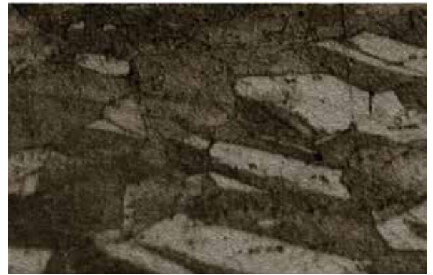
常规 CuCrZr 金相结构